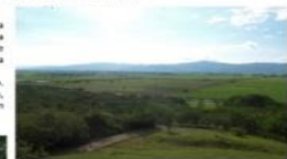
Figura 1. Panorámica valle geográfico