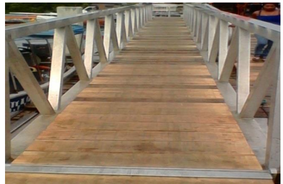
Reparaciones al muelle flotante