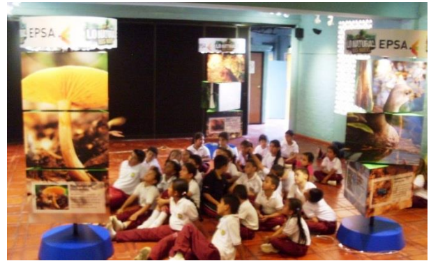
Presentación de la Exposición Flora y Fauna del embalse y central hidroeléctrica Calima , EPSA, Museo Arqueológico Calima, 5 al 9 de julio de 2014.