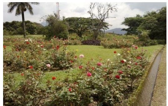
Limpieza de canales y pasillos