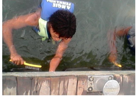
Limpieza subacuática y exterior muelle flotante