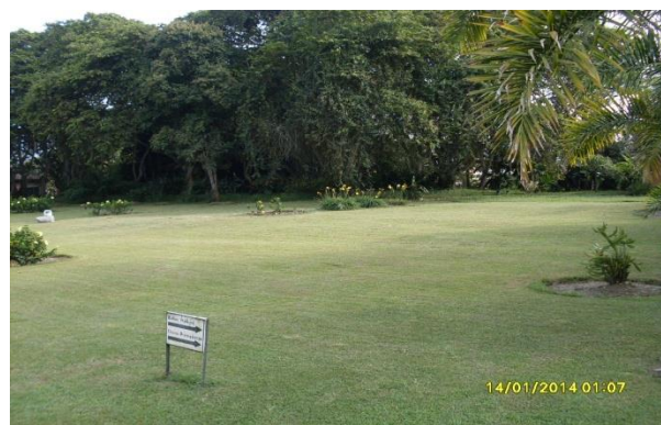
Actividades de mantenimiento y limpieza