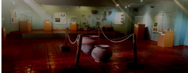
Exposición temporal La Sociedad Quimbaya Tardío Siglo X – XVI después de Cristo Presencia en el Valle del Cauca, Calima El Darién noviembre- diciembre de 2014.