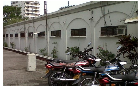
Limpieza de fachada