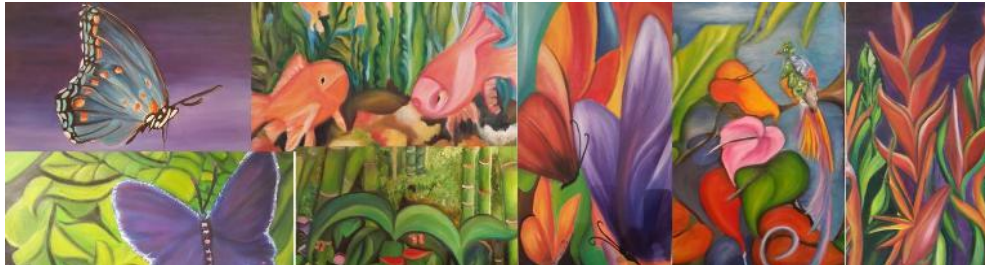
“ Colores de la Naturaleza ” exposición en asocio con el Colegio Hispanoamericano de Cali, del 22 al 31 de marzo de 2014.