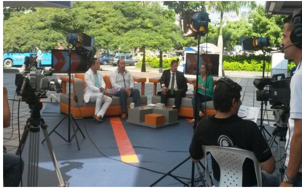
Amaneciendo , Telepacífico, 12 de junio de 2014