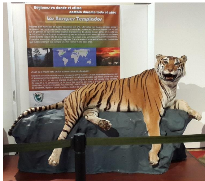
Exposición temporal Fauna del Mundo , Museo de Ciencias Naturales, Cali, octubre – diciembre 2014.