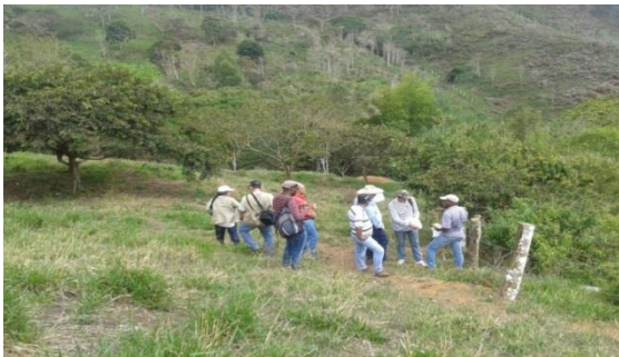
Salida de campo del equipo interdisciplinario del convenio.